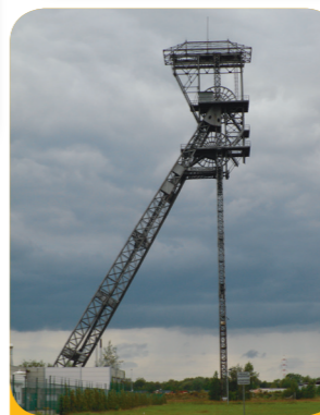
Abb. 7: Houthalen-Helchteren