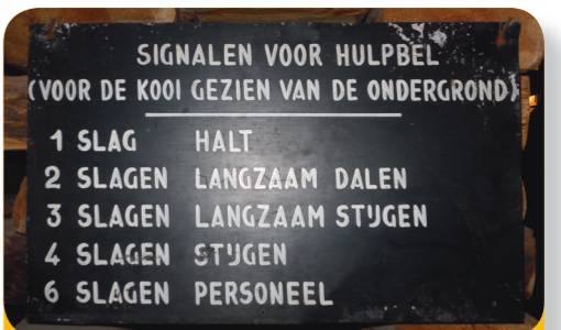
Abb. 8: Unter der Erde verständigte man sich mit einer Glocke.

Schöne Fotos unter industriedenkmal.de . Bergbaugeschichte in der Euregio und was daraus geworden ist: gruenmetropole.eu , paysdesterrils.eu