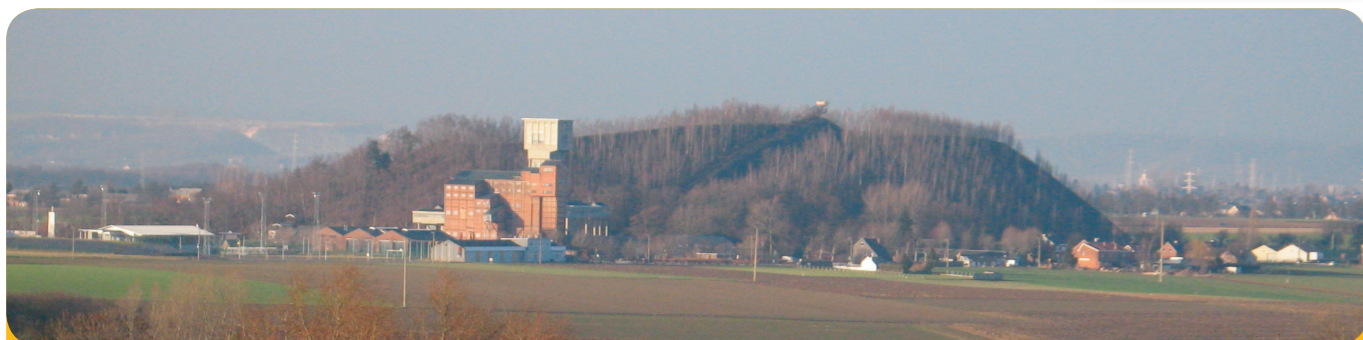
Abb. 4: Das Besucherbergwerk der Zeche Blegny mit ihrer Halde.

Wo Halden sind, waren früher auch Bergwerke . Hier arbeiteten die Bergleute („Kumpel“), die jeden Tag in die Gruben hinab fuhren, um die Kohlekumpen mit Spezialwerkzeug und Bohrmaschinen aus dem Gestein zu lösen. Manche Gruben waren mehr als 1.000 Meter tief. Dort unten herrschte große Hitze, und die Arbeit war sehr schwer und gefährlich. Deshalb wurden die Bergleute gut bezahlt.